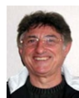
Michel Junac Communication, Aéronavale sur FSX,